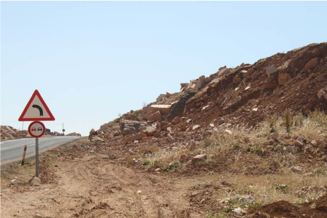
Fotoğraf 25. Rosularia blepharophylla Ulaşım ve Mermer Ocakları Tehdidi (Petekkaya)

Ziyaretçilerin genellikle alanı piknik yapmak için kullandıkları gözlenmiştir. Çöplerin alana gelişigüzel atılması, kayalıklarda ateş yakılması ve diğer faaliyetler alanın yaşam kalitesinde olumsuz değişime neden olmakta türe ve habitatına zarar vermektedir. Çöplerin