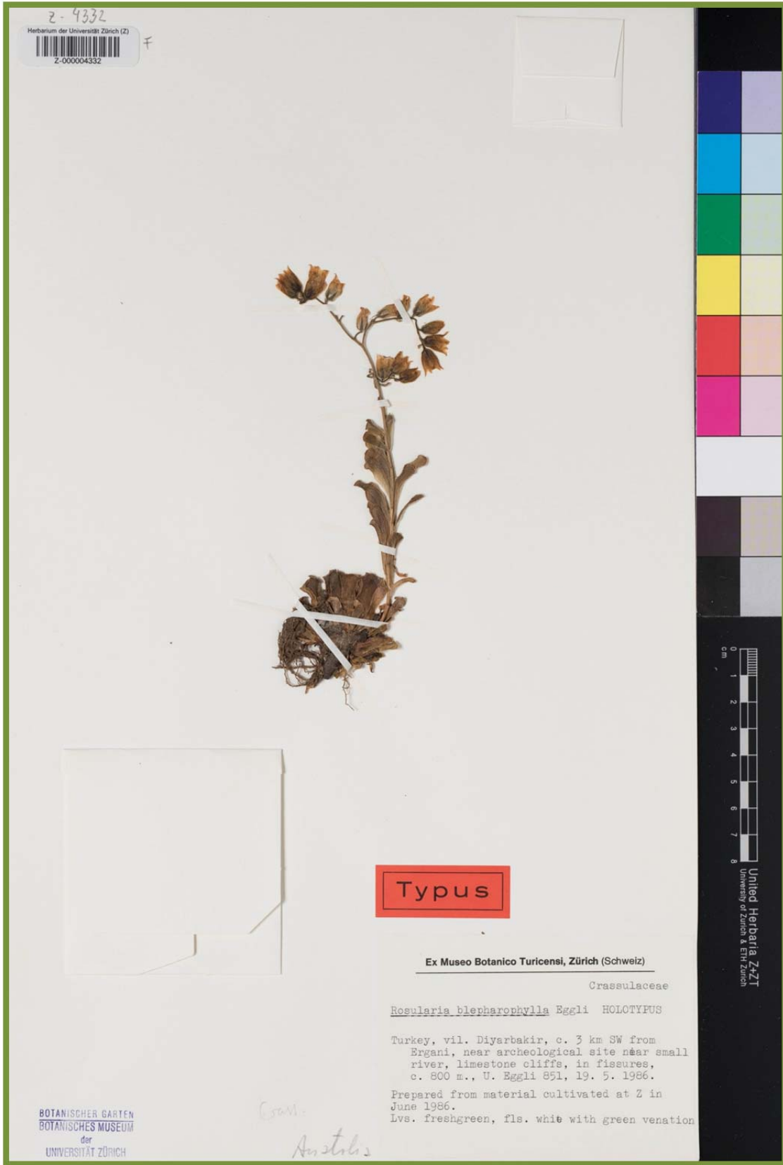
Fotoğraf 1. Rosularia blepharophylla Tip Örneği (Zürich Herbariumu ID: Z-000004332)