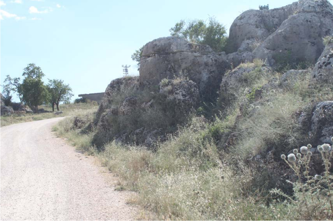
Fotoğraf 20. Rosularia blepharophylla Ulaşım Tehdidi (Ergani, Hilar Mağaraları)