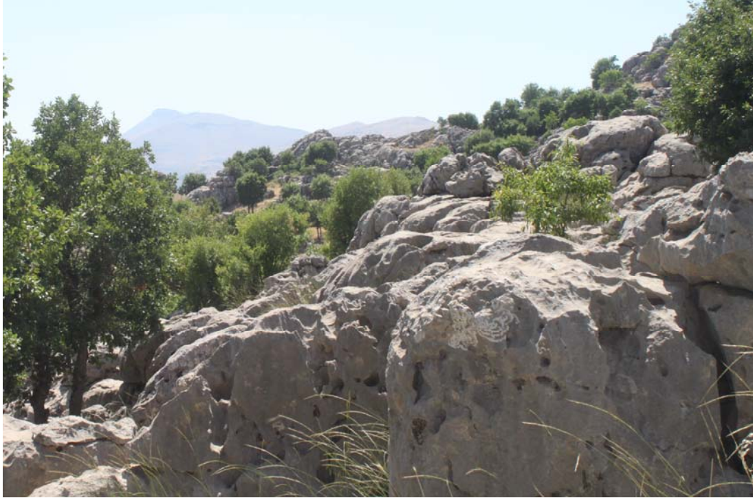
Fotoğraf 18. Rosularia blepharophylla Yaşam Alanı (Mırgan yaylası)

Türkiye Florasında uygulanmakta olan kareleme (grid) sistemine göre B7 karesi içinde yer alır (Davis,1965; Duman, 2000). R. blepharophylla , Diyarbakır iline özgü bir türdür.