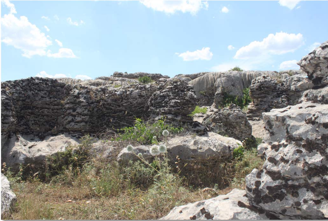
Fotoğraf 13. Rosularia blepharophylla Yaşam Alanı (Hilar mağaraları)