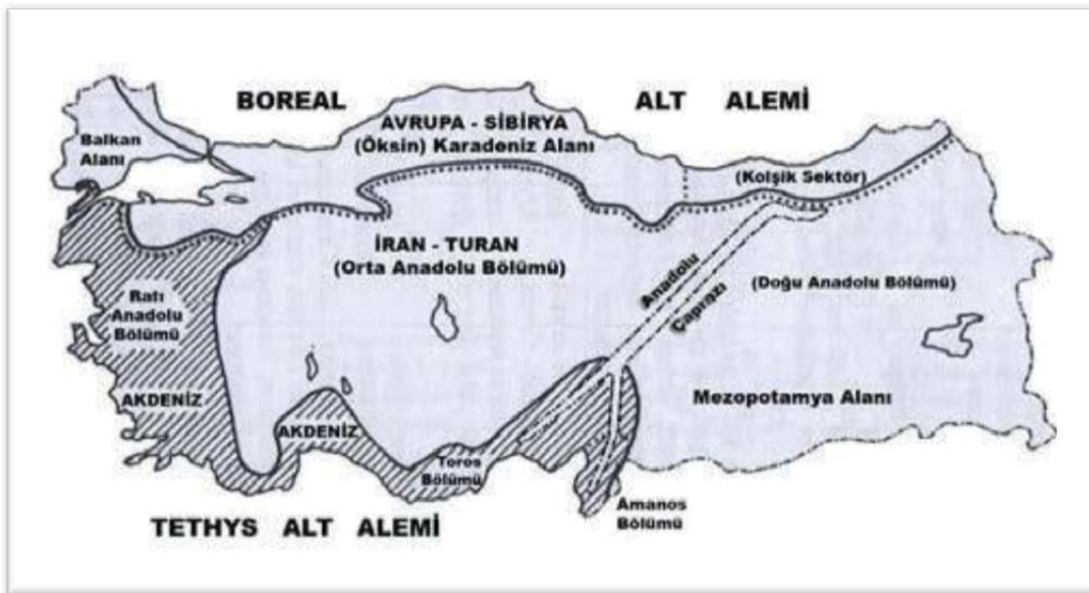
Şekil 1. Türkiye'nin Fitocoğrafya Bölgeleri ve Anadolu Çaprazı'nın Görünümü (Davis, 1971)

Enerji ve madencilik, ulaşım faaliyetleri, sosyal ve kültürel faaliyetler, türün yaşam alanları üzerinde en önemli tehdit unsurları olarak belirlenmiştir. Tür koruma eylem planı kapsamında, türün yaşam alanlarının korunabilmesi ve varlığını sürdürbilmesi ilgili Kaymakamlıklar, Belediyeler, Karayolları 9. Bölge Müdürlüğü ve MTA Güneydoğu Anadolu Bölge Müdürlüğü gibi paydaş kurumlarla işbirliği yapılmasının gerekliliğinin önemini ortaya koymaktadır. Tür koruma eylem çalışmaları hedef türün korunması ile sınırlı kalmayıp, habitatların ve yaşam alanlarıyla birlikte biyoçeşitliliğin korunmasına da katkı sağlamaktadır.