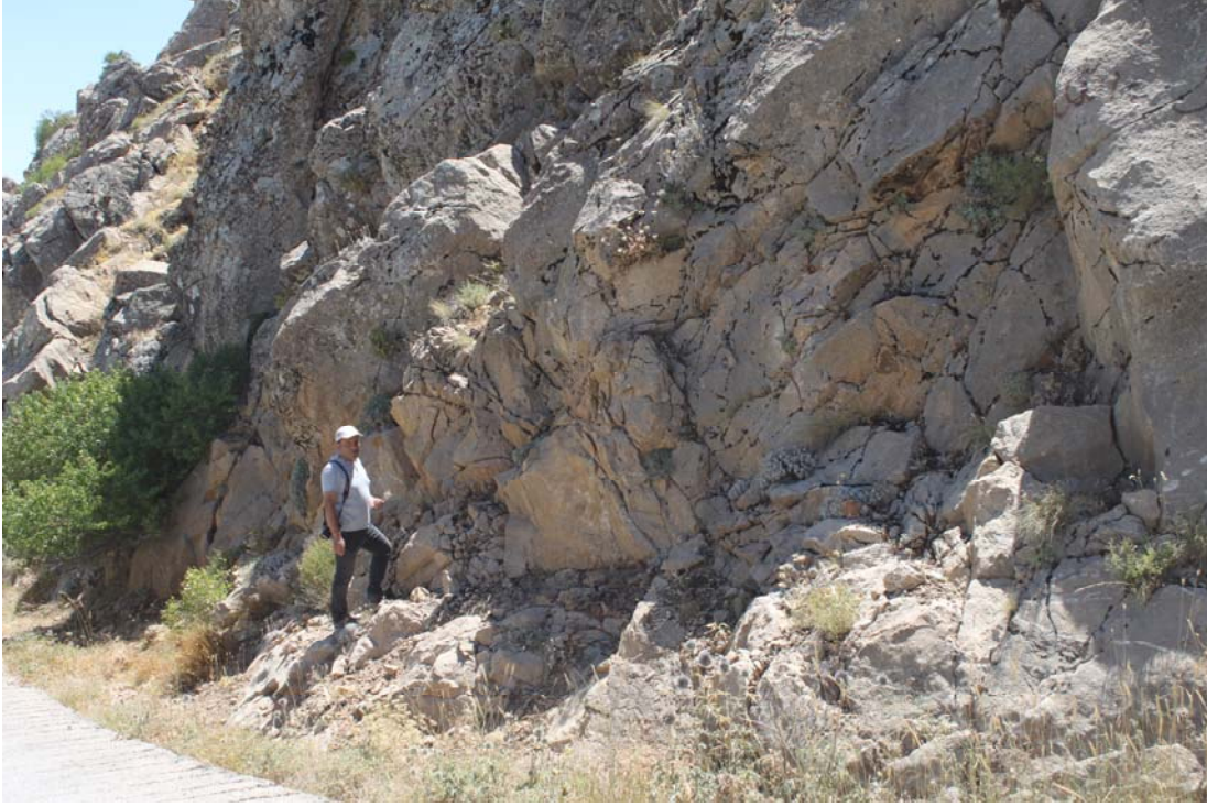
Fotoğraf 14. Rosularia blepharophylla Yaşam Alanı (Makamdağı, Nevzat Çiftçi-DKMP)