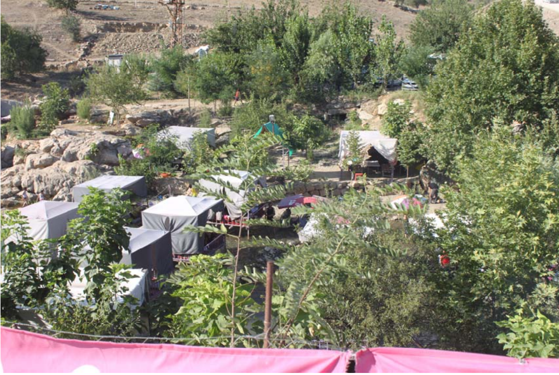
Fotoğraf 24. Rosularia blepharophylla Kültürel ve Sosyal Faaliyetler (Sinek çayı)