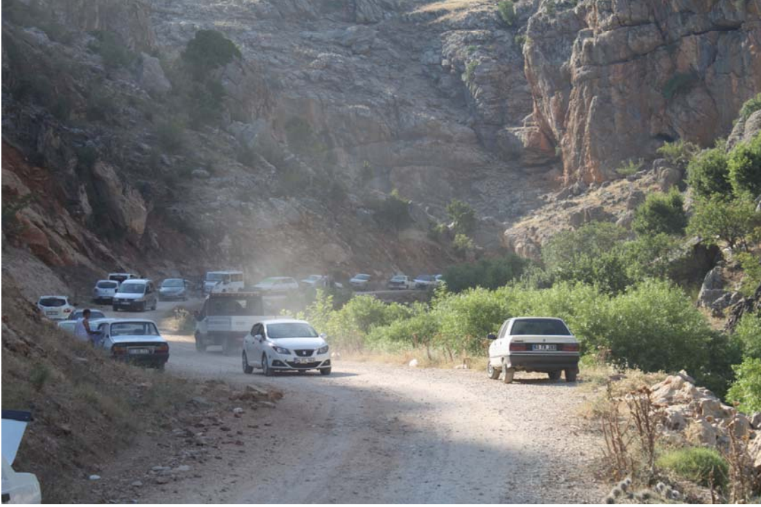
Fotoğraf 22. Rosularia blepharophylla Ulaşım Tehdidi (Çermik, Sinek çayı)