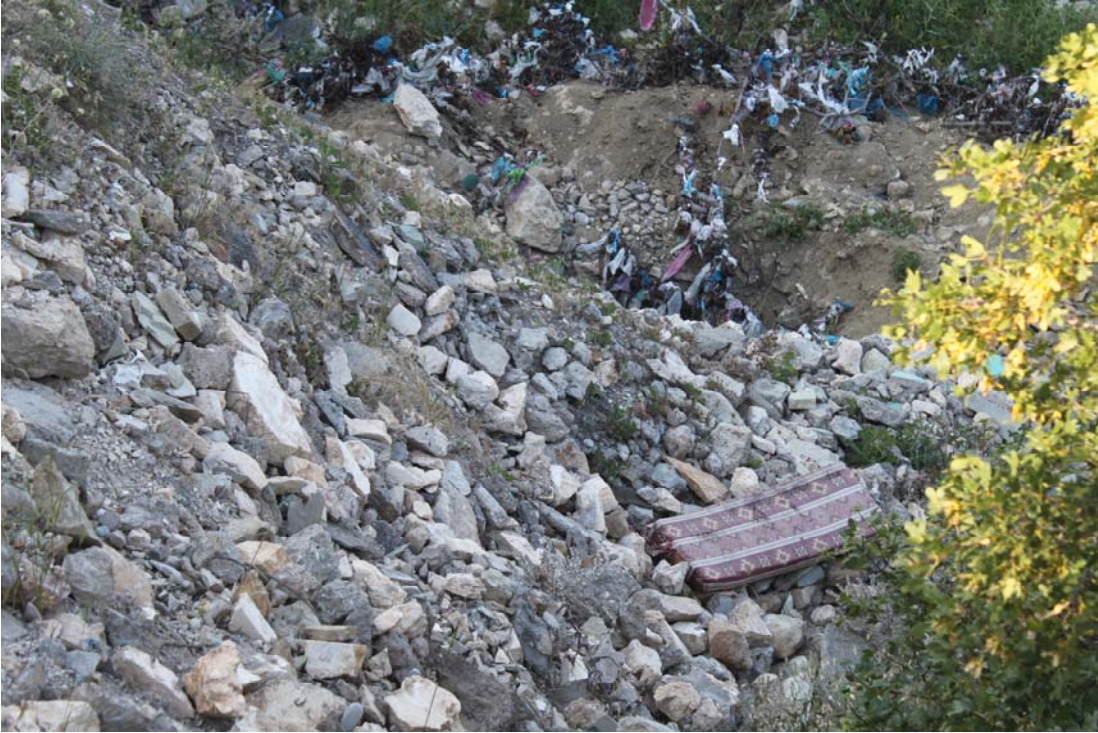
Fotoğraf 21. Rosularia blepharophylla Kirlilik Tehdidi (Ergani, Makamdağı)